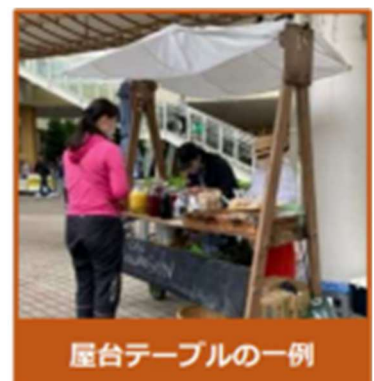
屋台テーブルの一例